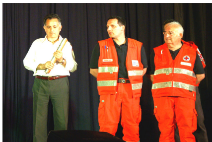
Croce Azzurra Sacro Cuore Vigevanese

La scossa che ha sconvolto l'abruzzo non ci ha lasciato inerti ed il mondo del volontariato è intervenuto massivamente per sostenere gli amici abruzzesi.